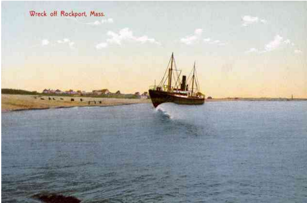
Gestrandeter britischer Frachter WILSTER bei Thatcher's Island, Massachusetts / USA

WIRD DAMPFER WILSTER GEBORGEN ? Rumpf scheint durch die Strandung nicht sehr beschädigt